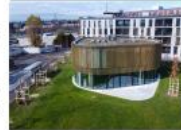
Bibliothèque - Transit